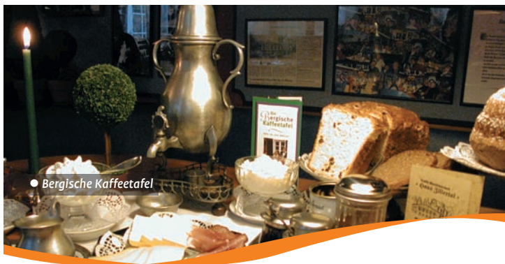
• Bergische Kaffeetafel